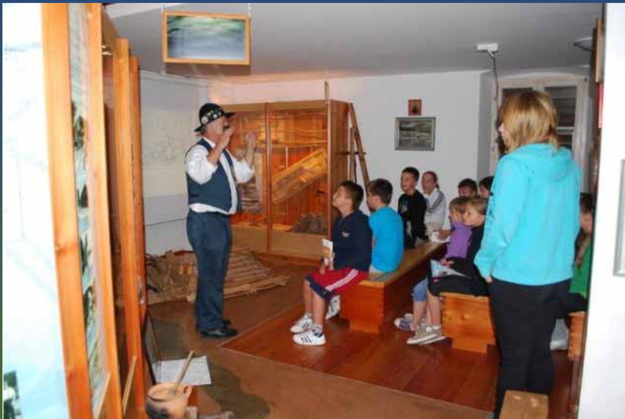
OBISK FLOSARKEGA MUZEJA