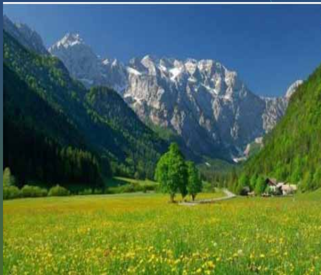
LOGARSKA DOLINA, NACIONALNI PARK SLOVENIJE